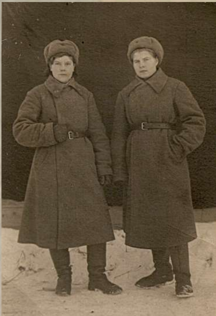
1942г. Смоленское направление 33 армия Центрального фронта